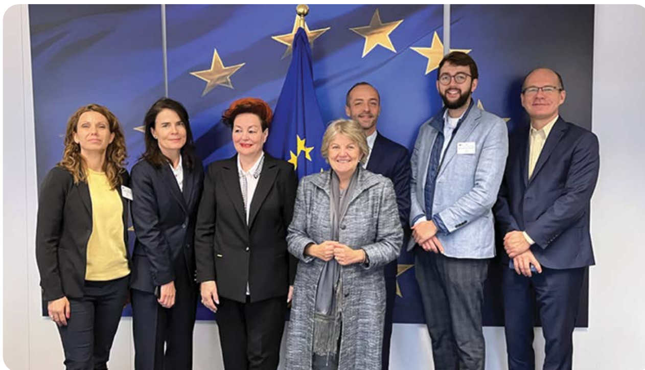
ZDJĘCIE 1. SPOTKANIE PRZEDSTAWICIELI ZE PAK-U I PARTNERÓW Z UNIJNĄ KOMISARZ ELISĄ FERREIRĄ I PRZEDSTAWICIELAMI KOMISJI EUROPEJSKIEJ W BRUKSELI W PAŹDZIERNIKU 2023 R.