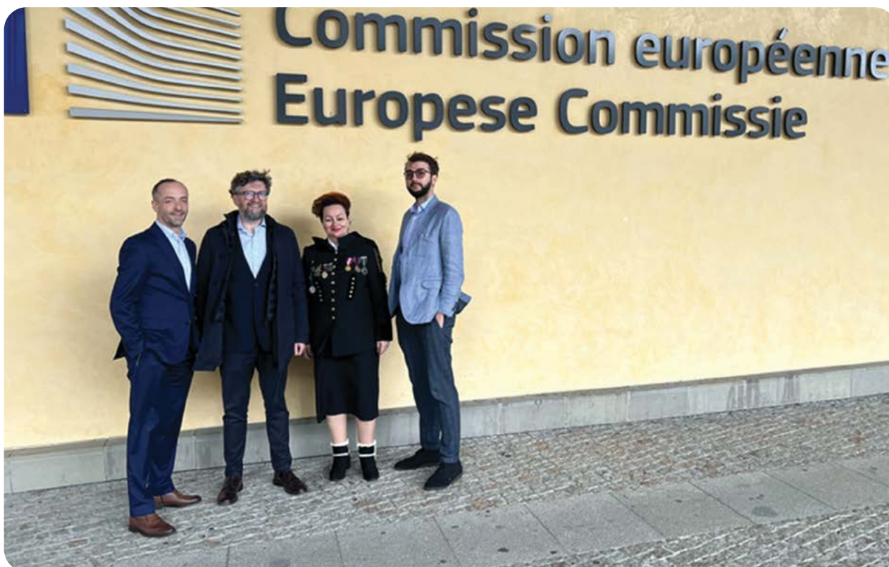
ZDJĘCIE 2. DELEGACJA PRZEDSTAWICIELI ZE PAK-U I FUNDACJI INSTRAT W BRUKSELI W LUTYM 2024 R.